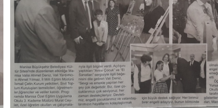
Yeni Manisa Gazetesi 04/12/2018