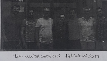
Yeni Manisa Gazetesi 14 Haziran 2019

Manisa Özel Eğitim Uygulama Okulu 3. Kademe Müdürlüğü'nün AB Erasmus+ 2018 Yılı "Daha Güzel Dünya Artistik" özel eğitim alanında gerçekleştirilen projenin tanıtımında. Önceki özel eğitim gereksinimi duyan bireylerin eğitiminde kullanılan yöntem ve teknikleri öğrenmek amacıyla Bilgiyi standartlarındaki en güncel eğitimi inceledi, sonrasında sanat eğitimi ile kendini ifade etme ve bunun özel eğitimde kullanılması konularını eğitim alan personel tarafından öğrendi.