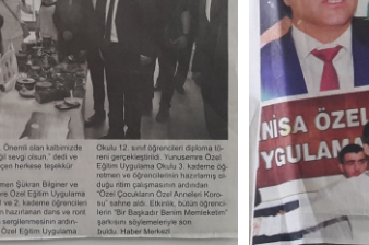
Yeni Manisa Gazetesi 04/12/2018

Manisa'da Engelliler Haftası etkinlikleri kapsamında düzenlenen programlar. Program kapsamında öğrenciler, engelli bireylerle tanışma ve iletişim kurma fırsatı buldu. Program kapsamında öğrenciler, engelli bireylerle tanışma ve iletişim kurma fırsatı buldu.