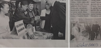
Güneş Gazetesi 15/05/2019

Manisa Valisi Ahmet Deniz, 'Emniyetten Engellilere WhatsApp' projesine katıldı. Proje kapsamında öğrenciler, emniyet mensuplarıyla iletişime geçerek ihtiyaçlarını bildirdi. Proje kapsamında öğrenciler, emniyet mensuplarıyla iletişime geçerek ihtiyaçlarını bildirdi.