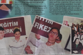
Yeni Manisa Gazetesi 04/12/2018