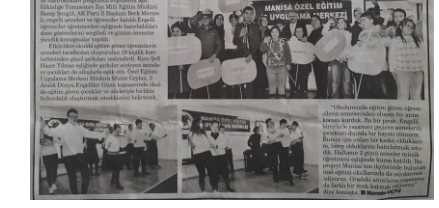
Yeni Manisa Gazetesi 14 Haziran 2019

Manisa'da Engelliler Haftası etkinlikleri kapsamında düzenlenen programlar. Program kapsamında öğrenciler, engelli bireylerle tanışma ve iletişim kurma fırsatı buldu. Program kapsamında öğrenciler, engelli bireylerle tanışma ve iletişim kurma fırsatı buldu.