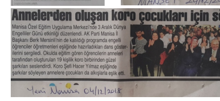
Yeni Manisa Gazetesi 04/12/2018

Manisa'da Engelliler Haftası etkinlikleri kapsamında düzenlenen programlar. Program kapsamında öğrenciler, engelli bireylerle tanışma ve iletişim kurma fırsatı buldu. Program kapsamında öğrenciler, engelli bireylerle tanışma ve iletişim kurma fırsatı buldu.