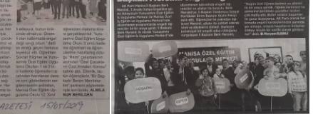
Güneş Gazetesi 15/05/2019

Manisa Valisi Ahmet Deniz, 'Emniyetten Engellilere WhatsApp' projesine katıldı. Proje kapsamında öğrenciler, emniyet mensuplarıyla iletişime geçerek ihtiyaçlarını bildirdi. Proje kapsamında öğrenciler, emniyet mensuplarıyla iletişime geçerek ihtiyaçlarını bildirdi.